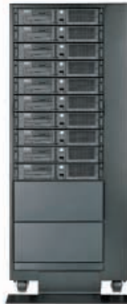
RS/6000 B50 jetzt mit 10.000- rpm-Ultra-SCSI- Funktionalität

Dieser Adapter ist besonders gut für den Einsatz im Entry-Rack-System B50 geeignet und ist ebenso in den Modellen 140 und 150 verfügbar. Der neu angekündigte Digital Trunk Resource-Adapter für ausgewählte Systeme stellt in Kombination mit anderen Hardware- und Software-Konnektivitätsoptionen Unterstützung für Spracherkennungsanwendungen bereit.