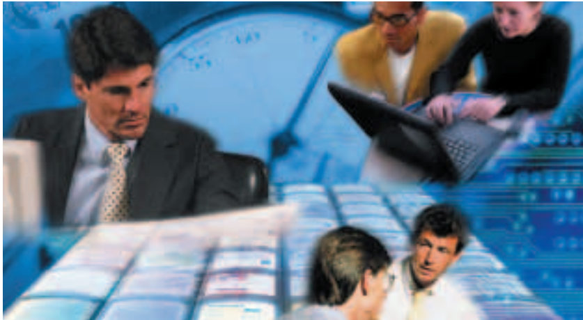
Immer mehr Unternehmen vergeben IT-Routineaufgaben an spezialisierte Dienstleister

IBM @server zSeries for On Demand Business