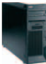
IBM xSeries 226 Express

Der IBM eServer xSeries 346 bietet in Umgebungen mit hoher Datendichte die Performance und Zuverlässigkeit, die für Ihr Unternehmen von Bedeutung sind. Die neue Unterstützung der Dual-Core-Intel Xeon-Prozessoren sorgt für zusätzlichen Investitionsschutz, hervorragende Performance und Zuverlässigkeit.